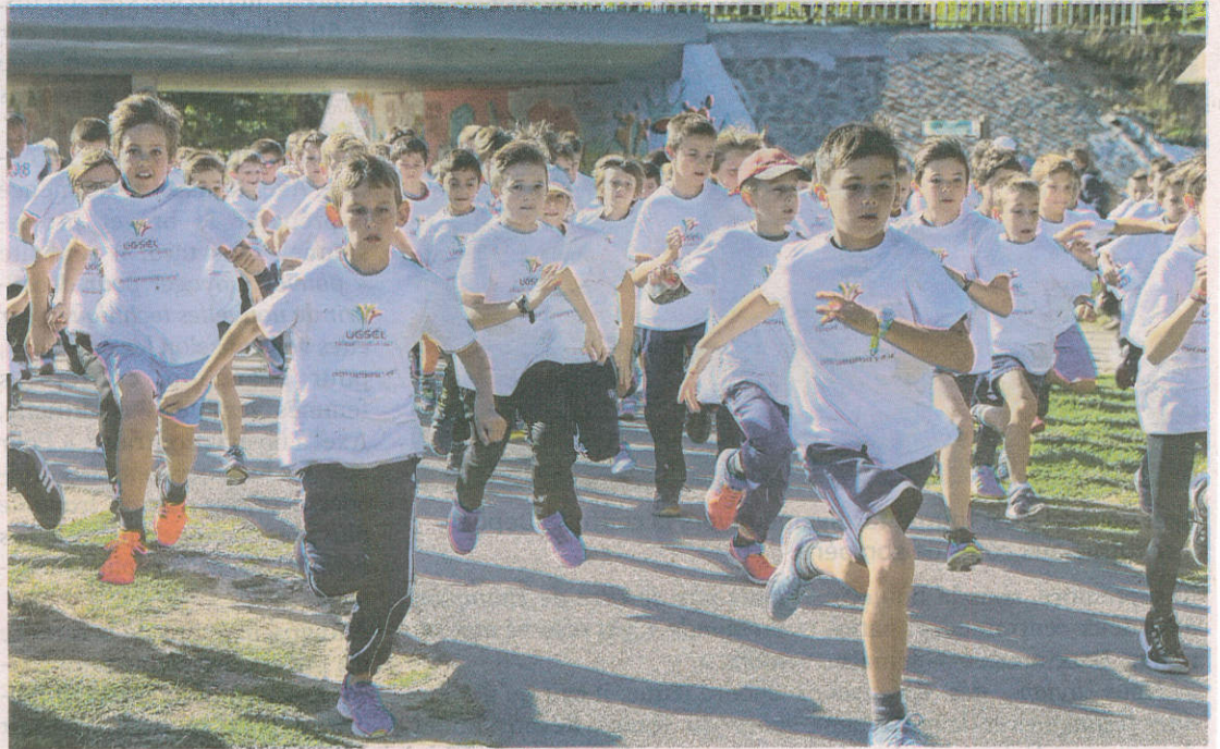
Près de huit cents élèves de CM1, CM2 et 6 e ont participé à l'épreuve.

Inscrit dans l'opération « Sport challenge santé », en lien avec l'Association des parents d'élèves de l'enseignement libre et la Fédération française de cardiologie, l'épreuve s'est déroulée dans des conditions idéales, avant un pique-nique réunissant l'ensemble des élèves.