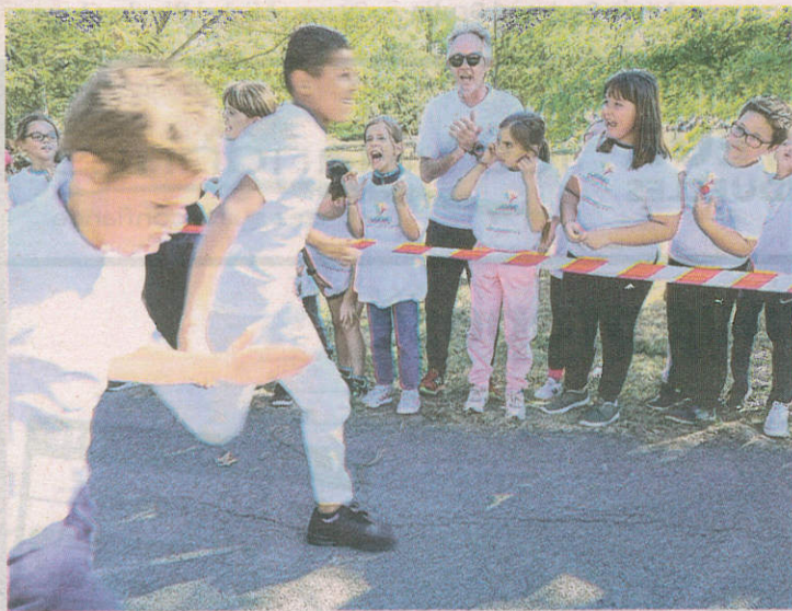
Après leur course, ils se sont mués en supporters.